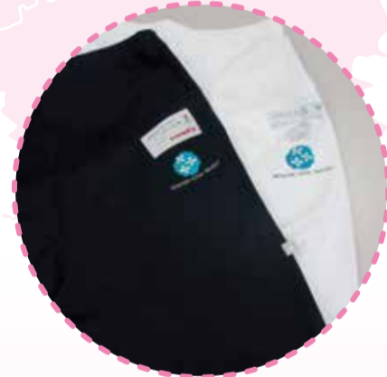
マタニティパンツ