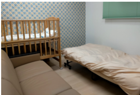
Breastfeeding & respite space