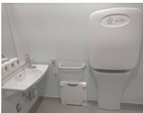
Baby changing table