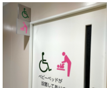
トイレ看板とドア表示