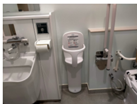
こどもトイレいす